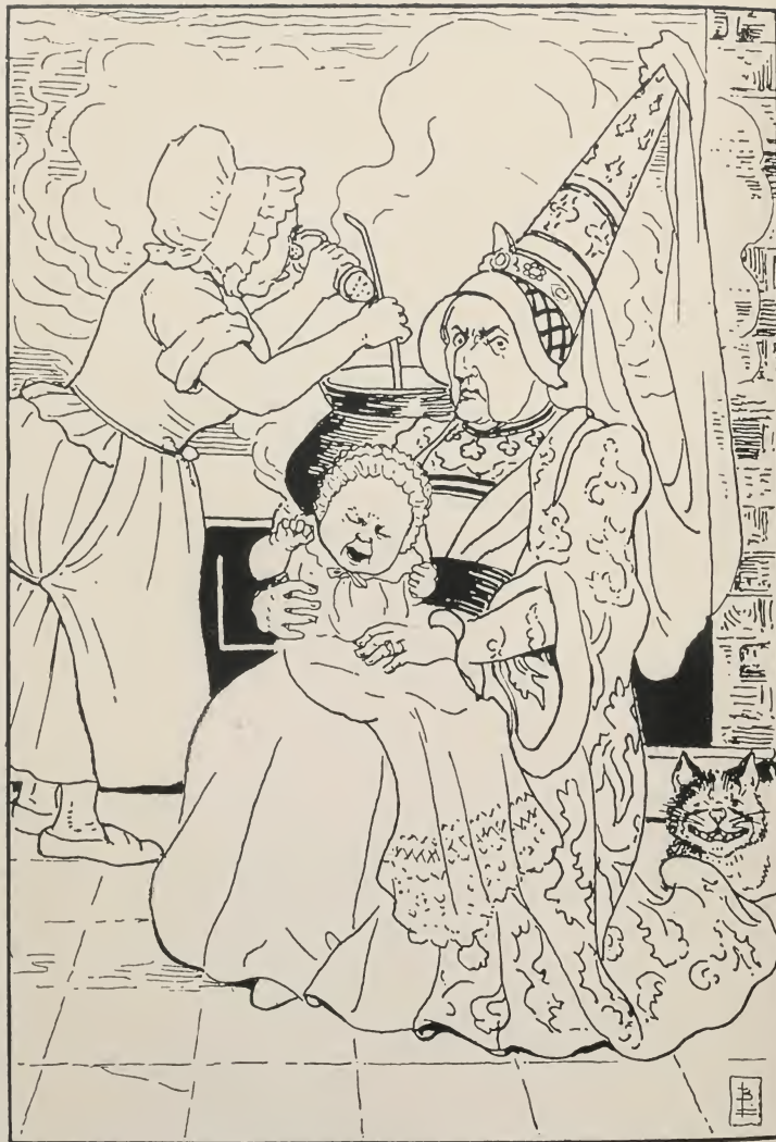
LA DUKINA KUIREJO.

“Ho, tute ne utilas paroli al li ” diris ŝi “li ja estas sencerbulo.”